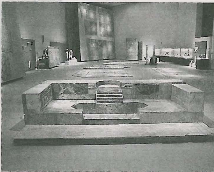
Αποψη του εκθεσιακού χώρου του Μουσείου Πατρών με τα ψηφιδωτά τοποθετημένα στο δάπεδο αλλά και όρθια σαν πίνακες ζωγραφικής

Την Παρασκευή τα επίσημα εγκαίνια, το Σάββατο ανοίγει για όλους