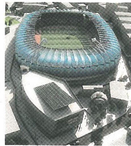
Στη βόρεια πλευρά του οικοπέδου χωροθετήθηκε ένας ανεξάρτητος κτιριακός όγκος, που φιλοξενεί εμπορικές και γραφειακές χρήσεις.

Με ταχύτατους ρυθμούς προχωρούν τα έργα στο νέο ποδοσφαιρικό γήπεδο της ΠΑΕ Λάρισας. Αν όλα συνεχιστούν κανονικά, το φθινόπωρο θα έχουμε εγκαίνια. Το συγκρότημα περιλαμβάνει επίσης τον αθλητικό ξενώνα της ομάδας, ένα εμπορικό-ψυχαγωγικό κέντρο και πολιτιστικές λειτουργίες. Η ανάπτυξη, περιμετρικά της κεντρικής πλατείας, διαδοχικών δραστηριοτήτων που θα αλληλεπιδρούν μεταξύ τους, εξασφαλίζοντας παράλληλα ζωτικό χώρο για τους πεζούς, αποτέλεσε την αρχική σχεδιαστική χειρονομία. Θυμίζοντας ένα καυτό από φως που ανοίγει αποκαλύπτοντας το περιεχόμενό του, το στέγαστρο του γηπέδου σχηματίζει ένα τοπίο από τεθλασμένες επιφάνειες, το οποίο δημιουργεί ένα συνεχές οπτικό μέτωπο στο ανατολικό όριο της πλατείας. Αντίστοιχα οι δύο όγκοι του εμπορικού κέντρου πλαισιώνουν τις υπόλοιπες πλευρές της. Η εκτεταμένη χρήση γυαλιού, ανοδιωμένου αλουμινίου και γραμμικών μεταλλικών στοιχείων αναδεικνύει μια ανάλαφρη αρχιτεκτονική, που λειτουργεί ως φίλτρο για το φως της ημέρας και ως λαμπερή σθόνη τη νύχτα.