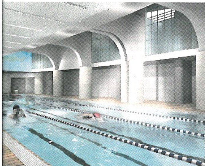
Εξαιμένες κολύμβησης φωτίζονται με επαρκή φυσικό φωτισμό.