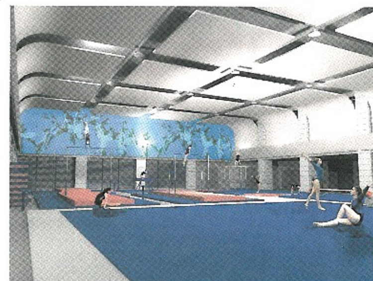
Η κλειστή αίθουσα για τους αθλητές του τμήματος ενόργανης γυμναστικής.