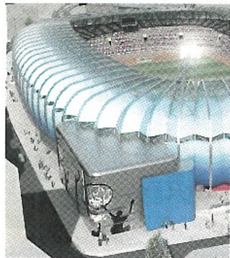
Το κλειστό γήπεδο καλαθοσφαίρισης, που στεγάζεται σε έναν από τους δύο ορθογωνικούς όγκους, νότια του συγκροτήματος.