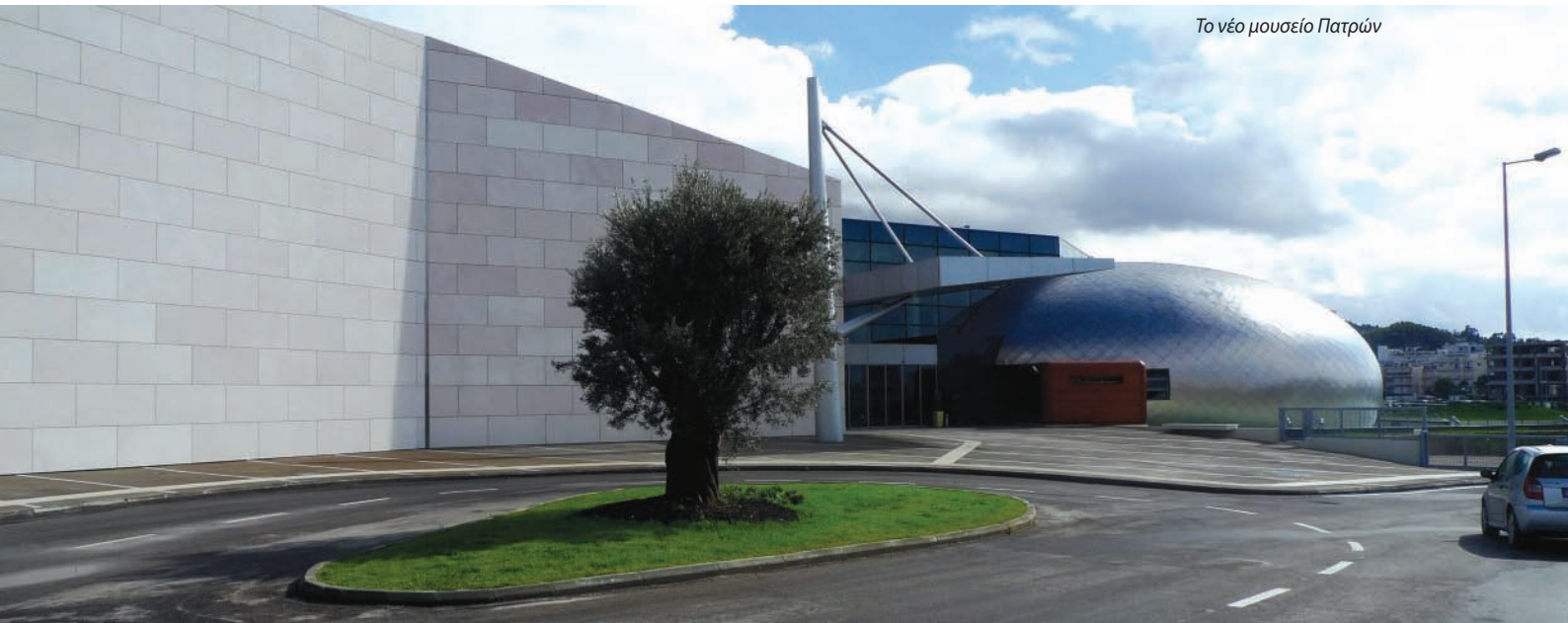
Το νέο μουσείο Πατρών

«Η ΑΙΣΘΗΤΙΚΗ ΚΑΙ Η ΠΟΙΟΤΗΤΑ ΤΩΝ ΚΤΗΡΙΩΝ ΚΑΙ ΤΩΝ ΠΟΛΕΩΝ, ΣΥΝΟΛΙΚΑ ΣΕ ΚΑΘΕ ΠΕΡΙΟΔΟ, ΑΠΟΤΥΠΩΝΕΙ ΠΙΣΤΑ ΤΟΝ ΠΟΛΙΤΙΣΜΟ ΤΗΣ ΣΥΓΚΕΚΡΙΜΕΝΗΣ ΠΕΡΙΟΔΟΥ.»