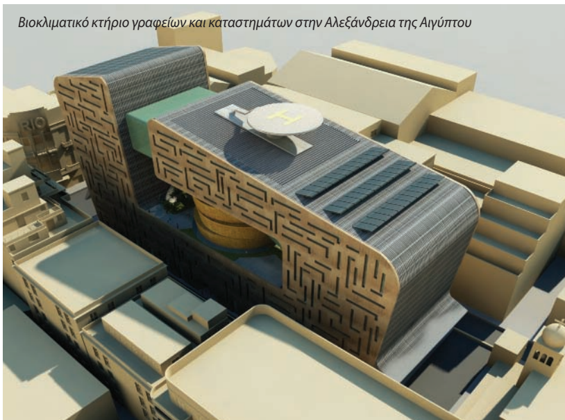
Βιοκλιματικό κτήριο γραφείων και καταστημάτων στην Αλεξάνδρεια της Αιγύπτου