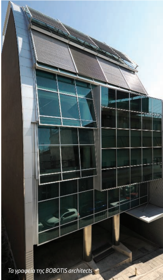
Τα γραφεία της BOBOTIS architects

Κάθε φορά που σχεδιάζεται ένα κτήριο, εμπεριέχει το σύνολο των δεξιοτήτων, που