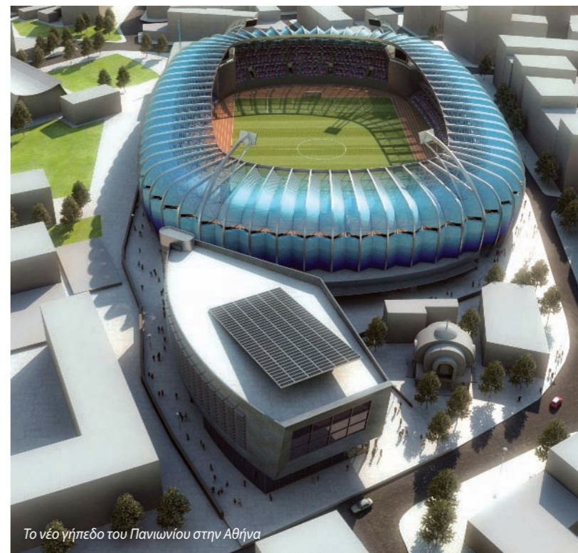
Το νέο γήπεδο του Πανιωνίου στην Αθήνα

«ΥΠΕΥΘΥΝΟΙ ΔΕΝ ΕΙΜΑΣΤΕ ΜΟΝΟ ΓΙΑ Ο,ΤΙ ΚΑΝΟΥΜΕ, ΑΛΛΑ ΚΑΙ ΓΙΑ Ο,ΤΙ ΔΕΝ ΚΑΝΟΥΜΕ. Η ΕΥΘΥΝΗ ΓΙΑ ΤΗΝ ΑΙΣΘΗΤΙΚΗ ΤΩΝ ΠΟΛΕΩΝ ΑΝΗΚΕΙ ΣΕ ΟΛΟΥΣ. ΑΝΗΚΕΙ ΣΕ ΕΚΕΙΝΟΥΣ ΠΟΥ ΤΗ ΔΙΑΜΟΡΦΩΝΟΥΝ ΚΑΙ ΣΕ ΕΚΕΙΝΟΥΣ ΠΟΥ ΤΗΝ ΑΠΟΔΕΧΟΝΤΑΙ.»