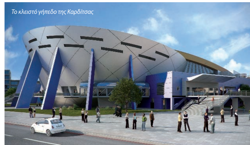
Το κλειστό γήπεδο της Καρδίτσας

Γενικά οι πόλεις μας έχουν ανάγκη από σημαντικά αρχιτεκτονικά έργα. Η Λάρισα έχει πολλές ευκαιρίες και στο κέντρο της πόλης να παρουσιάσει ποιοτικά κτίρια. Θα μπορούσε πράγματι να αποκτήσει μια εικόνα μιας πόλης με πραγματική σύγχρονη αισθητική. Θα ήταν ιδιαίτερη τιμή για μένα να συμμετέχω προς την κατεύθυνση αυτή. _